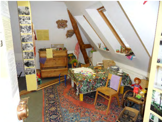
z.B. Lernwerkstattraum „Kinderladenbewegung“

Die Lernwerkstatt Kita-Museum bietet die Gelegenheit, pädagogische Ansätze und die elementaren Bildungsbereiche mit Herz, Hand, Verstand und einem Weilchen Zeit wirklich zu be-greifen .