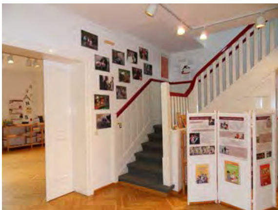
Foyer der Lernwerkstatt